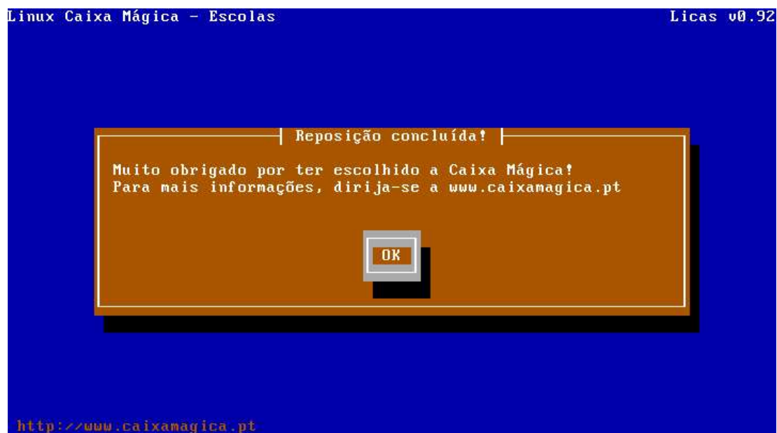
Imagem 6 – Final da Instalação