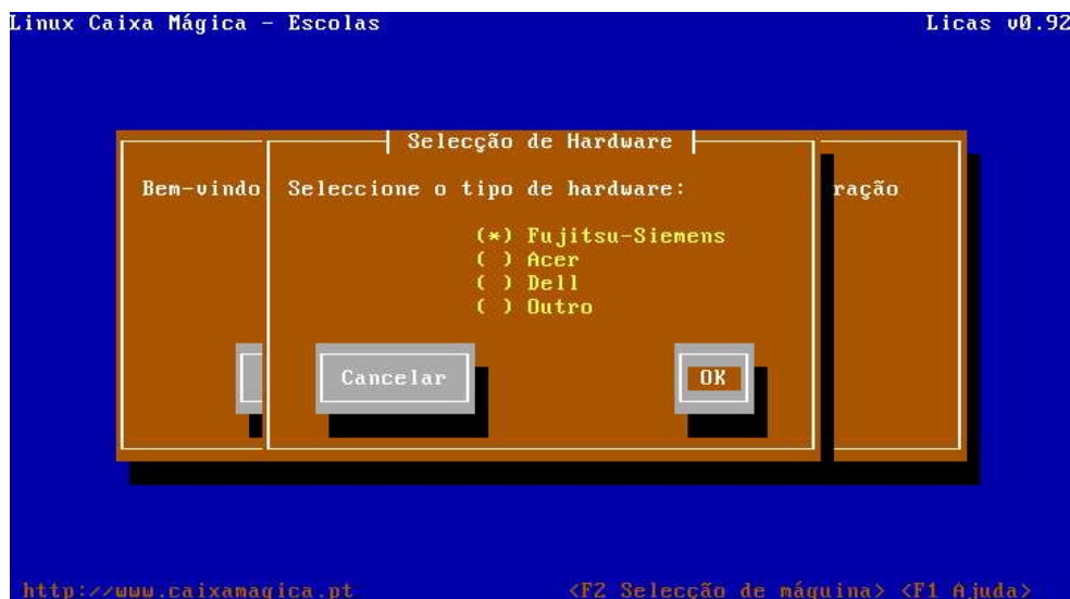
Imagem 3 – Ecrã de escolha do hardware/fabricante

É ainda possível escolher neste ecrã qual o tipo de hardware/fabricante onde está a ser feita a instalação pressionando a tecla de função "F2".