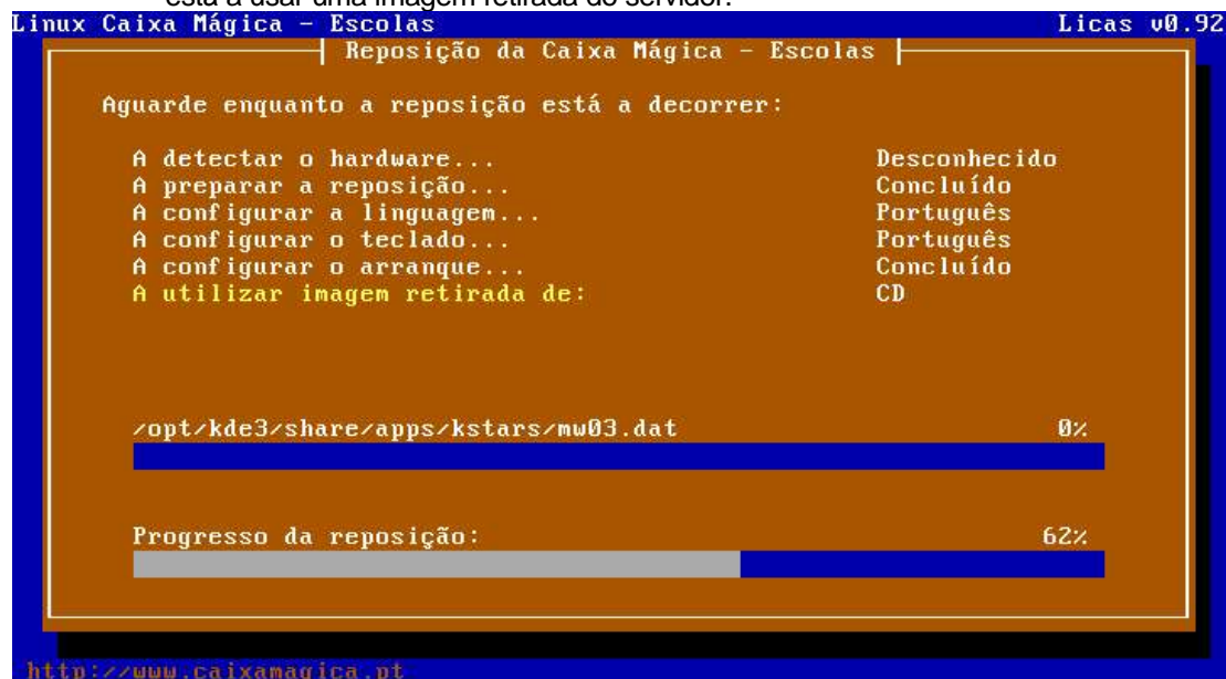
Imagem 5 - Progresso da Instalação – A usar a imagem do CD

Podemos verificar na imagem 4 que a instalação a decorrer está a ser efectuada para hardware desconhecido (logo nenhum dos 3 fabricante principais), e que se está a usar uma imagem retirada do servidor.