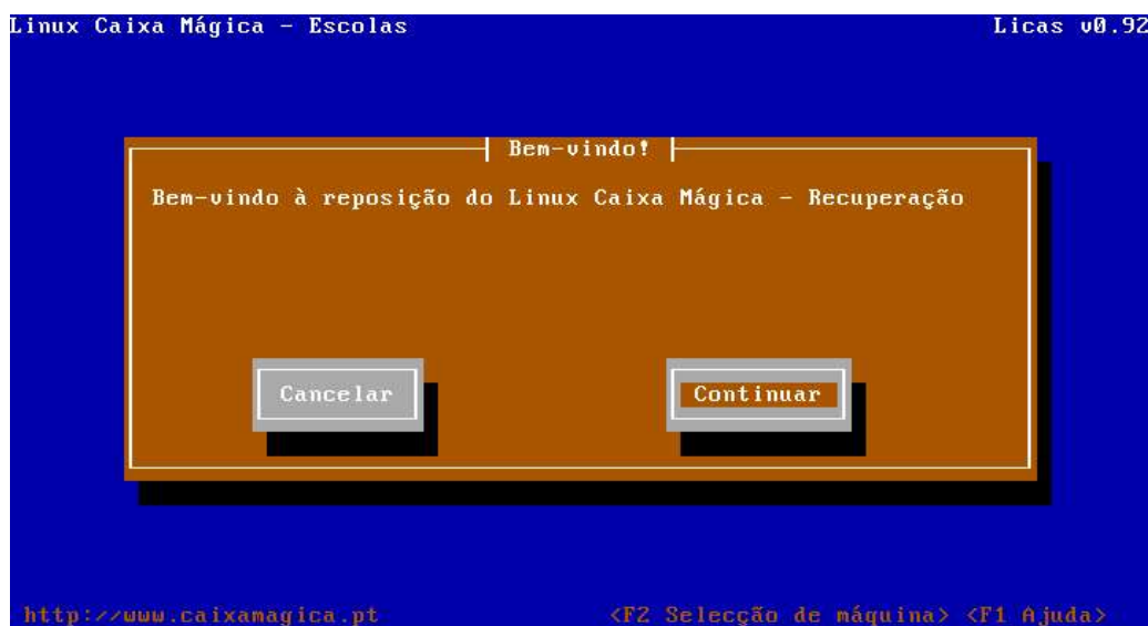
Imagem 2 – Primeiro ecrã de instalação

3º) Após algumas linhas de inicialização a instalação deverá parar num ecrã onde terá a hipótese de prosseguir a instalação normalmente escolhendo o botão “Continuar”, ou cancelar a instalação pressionando o botão “Cancelar” que reiniciará o computador sem efectuar nenhuma alteração ao sistema.